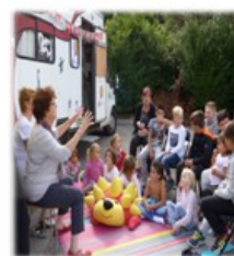
Le camion pédagogique, action co financée par le REAAP

Il est ouvert à tous autres adolescents (filles